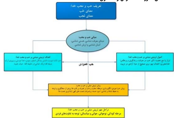
شکل ۲) الگوی مفهومی پژوهش

این یافته‌ها با یافته‌های پژوهش آزاد مظلوم [9]، احمدپور دهقان [11] هم‌سو است. در خصوص سؤال ششم پژوهش مربوط به شناسایی مراحل مهم تربیتی مبتنی بر حب و محب خدا از منظر قرآن می‌توان گفت مرحله کودکی، نوجوانی، جوانی و میانسالی از مهم‌ترین مراحل تربیت در الگوی تربیت مبتنی بر حب خدا از نظر قرآن هستند. همچنین از یافته‌های پژوهش می‌توان استنباط نمود که توجه به تفاوت‌های فردی در همه مراحل مهم تربیتی از اهمیت ویژه‌ای برخوردار هستند، این یافته با یافته‌های پژوهش آزاد مظلوم [9]، احمدپور دهقان [11]، صالحی سمندی [14] و شیروانی شیرینی [7] هماهنگ است. یافته‌های مربوط به سؤال هفتم پژوهش در خصوص طراحی الگوی مطلوب تربیتی مبتنی بر حب خدا از منظر قرآن نشان داد که الگوی طراحی‌شده دارای شش بعد اصلی و